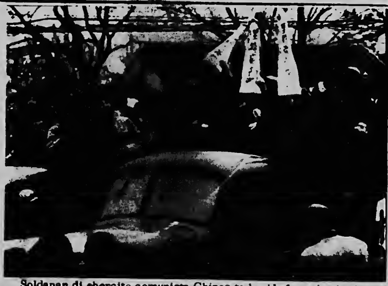
Soldanan di ehercito comunista Chines ta hasi bafon y hari mientras cu nan companeronan ta corre cu algun persona cu ta ser acusa di ta contra e revolucion di Mao Tse Tung. Nan a pone un petchie riba nan cabes cu nan number riba dje. Asina nan ta corre cu nan den cayanan di Pekin.